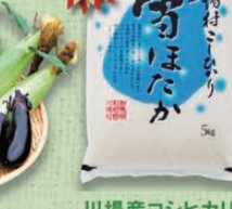
川場産コシヒカリ「雪ほたか」