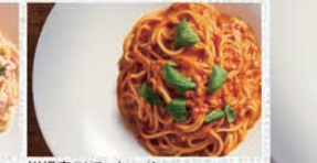
川場産ストラクキーノとフレッシュパプリカのトマトソース