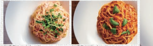
川場産リコッタチーズと明太子のパスタ

ホテル田園プラザのイタリアンシェフ監修のトマト・ポロネーゼ・和風の3種のソースがベースとなったパスタメニューが新登場。全ての商品にこだわりの生パスタを使用。サラダ食べ放題もセットになった絶品パスタをお楽しみください。 お問合せ/TEL0278-52-3717