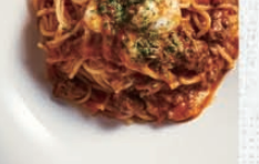
川場産モッツァレラのポロネーゼ