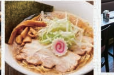
川匠オリジナルの中華ダレ「中華そば」