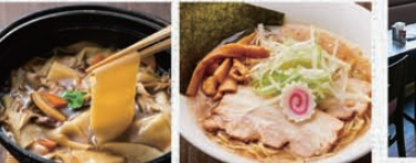
群馬の郷土料理「おきりこみ」

川匠オリジナルの中華ダレを、鶏がら・魚介を炊いて作ったWスープと合わせ旨みたっぷりの味わいの中華そばが大人気。また地場の野菜をたっぷり使用した群馬の郷土料理「おきりこみ」も絶品です。 ※テラス席はベッパ可